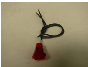
CODIGO: XXPILFLEC DESCRIPCION: PILOTO FLECHA INDICADOR TERMOSTATO