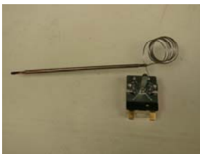
CODIGO: XXTEG320 DESCRIPCION: TERMOSTATO PLANCHA 50-320°