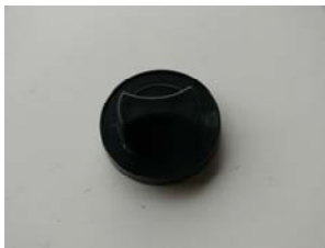
CODIGO: XXMANBAQ DESCRIPCION: MANDO BAQUELITA TERMOSTATO