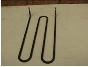
CODIGO: R22530 DESCRIPCION: RESISTENCIA 1333W